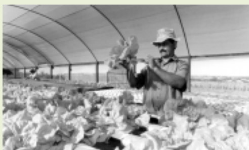
Núcleo de Ciências Agrárias - Montes Claros