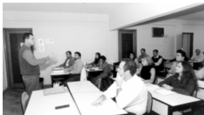
Sala de aula na FACE