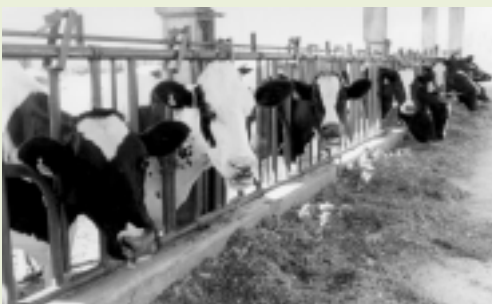
Fazenda Experimental - Igarapé