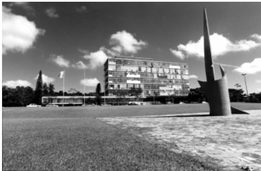
Prédio da Reitoria

Como resultado de uma consistente política de investimento na qualificação, 87% dos professores da UFMG são pós-graduados, sendo 61% doutores e 26% mestres. A grande maioria dos funcionários técnico-administrativos possui formação de nível médio e superior. Essa competência, posta a serviço do ensino, da pesquisa e da extensão nas diversas áreas do conhecimento, faz da UFMG um importante veículo do desenvolvimento regional e nacional.