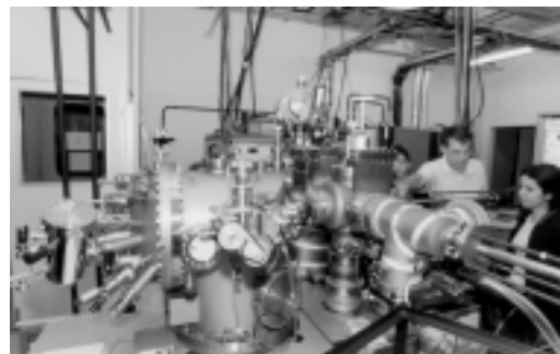
Laboratório de Física no ICEX

O Calendário Escolar, aprovado, anualmente, pelo CEPE, registra todas as informações importantes para o ano letivo. Consultá-lo é essencial para a vida acadêmica do aluno.