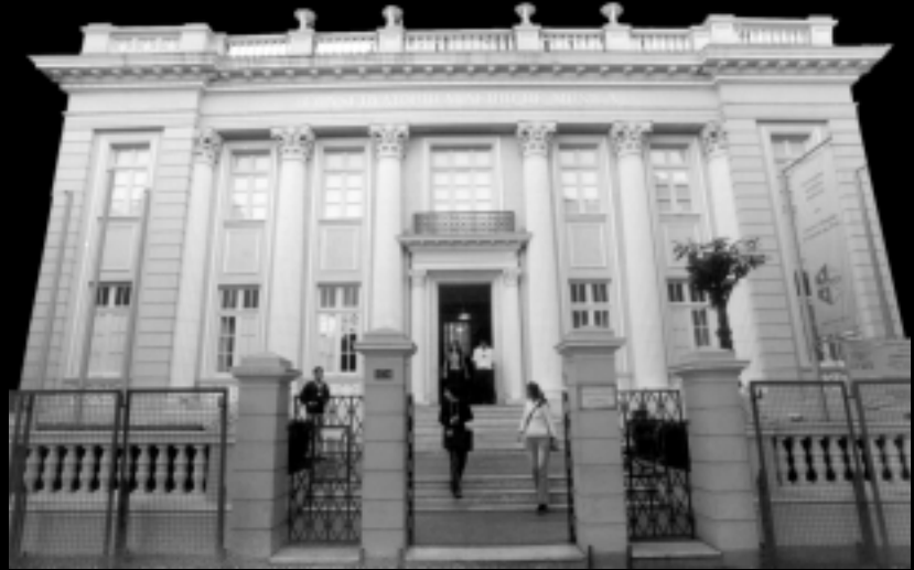
Conservatório de Música da UFMG