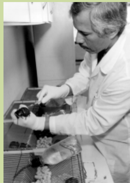
Laboratório de Biofísica

Estudos feitos pelo aluno em outras instituições de ensino superior, antes do ingresso na UFMG, e disciplinas isoladas cursadas com aproveitamento na UFMG poderão, eventualmente, ser aproveitados para integralização do curso. Para isto, o aluno deverá solicitar a(s) dispensa(s) junto ao Colegiado de seu curso, apresentando o(s) respectivo(s) programa(s) e o histórico escolar.