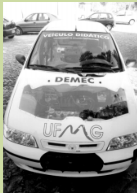
Veículo Didático - Engenharia Mecânica