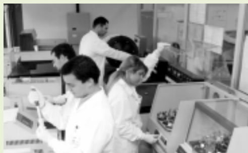
Laboratório de Virologia - ICB