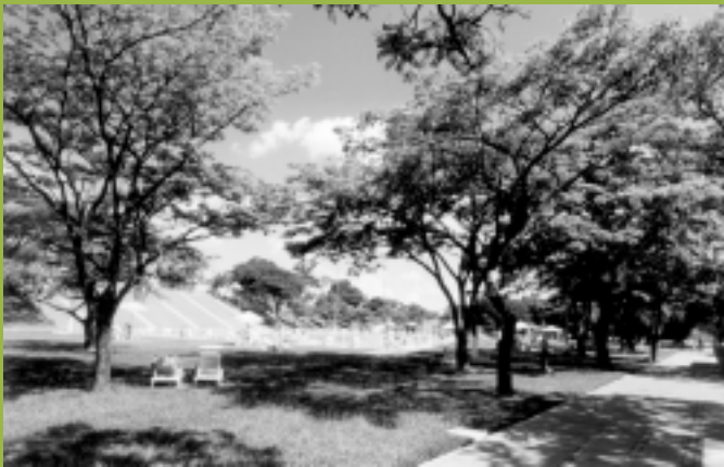
Centro Esportivo Universitário - CEU