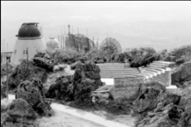
Observatório Astronômico da Serra da Piedade