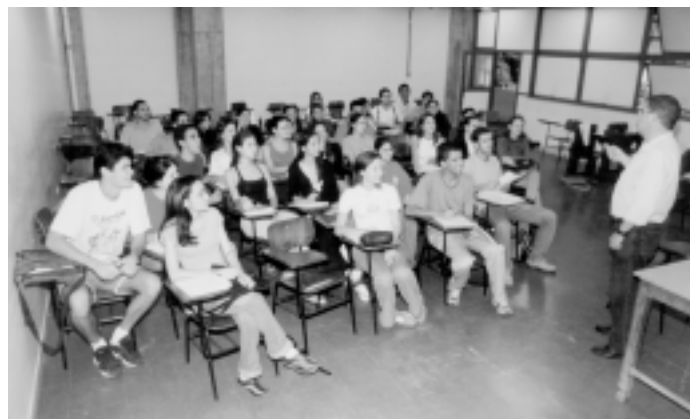
Sala de aula no ICB

Para ingresso em alguma das modalidades acima os interessados devem observar os requisitos e prazos fixados pelo calendário escolar, podendo obter maiores informações junto ao DRCA ou aos Colegiados dos cursos.