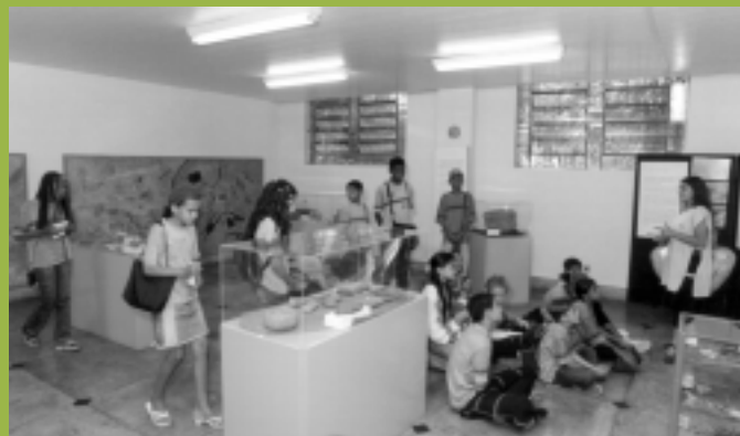
Aula de Arqueologia - Museu de História Natural