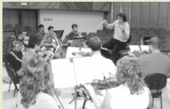
Orquestra Sinfônica da UMG - Escola de Música