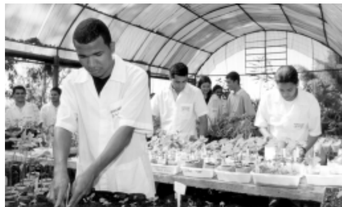
Estufa de plantas medicinais no Núcleo de Ciências Agrárias - Montes Claros