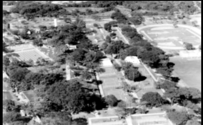
Centro Esportivo Universitário - CEU