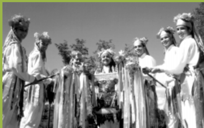
Saranandeiros da Escola de Educação Física

O Museu de História Natural e Jardim Botânico fica localizado numa área de 600 mil metros quadrados em Belo Horizonte. Lá está localizado o Espaço Professor Amílcar Vianna Martins, que abriga exposição permanente de Paleontologia, e o presépio do Pipiripau, uma das mais importantes obras de artesanato popular de Belo Horizonte.