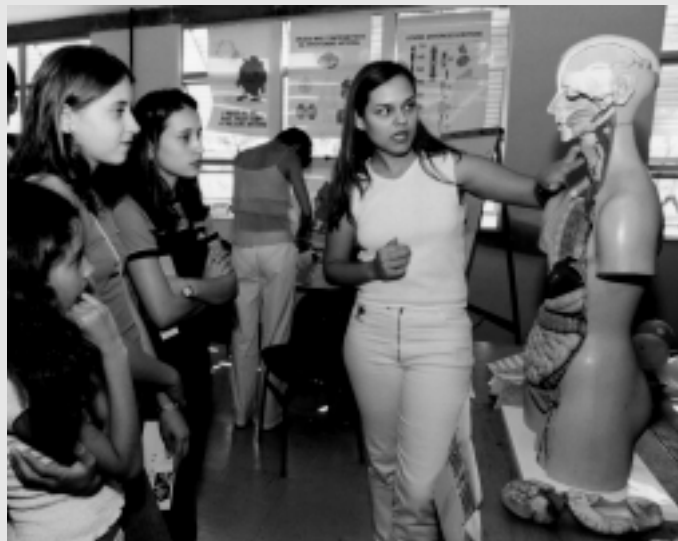
Semana do Conhecimento

Os resultados do PAD, PID e PAE e de Iniciação Científica, são apresentados em eventos próprios que constam do Calendário Acadêmico da UFMG, sendo obrigatório para os bolsistas a apresentação de seus trabalhos sob forma de pôsteres ou outros, nos referidos eventos.