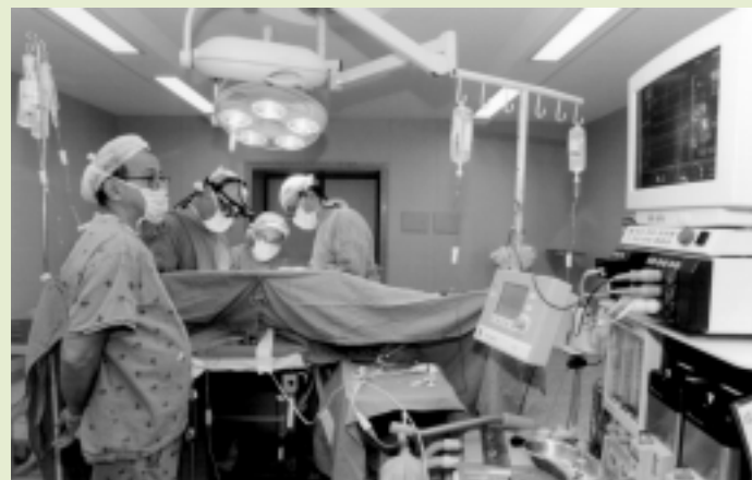
Bloco cirúrgico da Escola de Enfermagem - Hospital das Clínicas