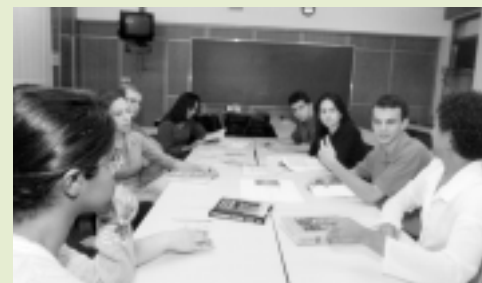
Administração - FACE