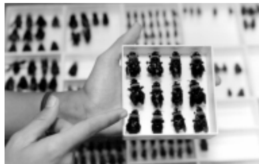
Laboratório de Entomologia no ICB

Departamento de Registro e Controle Acadêmico (DRCA): centraliza e executa o controle dos processos administrativos relacionados à vida acadêmica do aluno, do ingresso na Universidade à emissão do diploma. Para isto conta com o sistema acadêmico, que constitui um conjunto de dados informatizados que permite monitorar o desenvolvimento individual do estudante e acompanhar as alterações curriculares dos cursos a partir do lançamento realizado pelo Setor Acadêmico da Prograd, após aprovação da Câmara de Graduação.