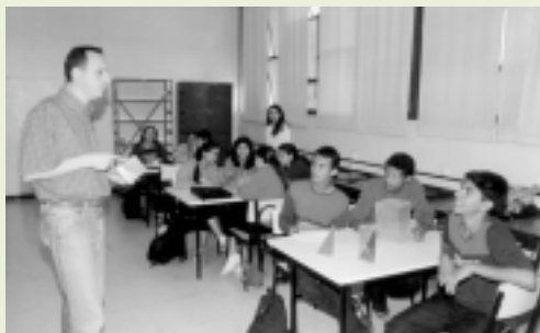
Sala de aula no Colégio Técnico - Coltec

A UFMG ocupa 8,8 milhões de metros quadrados, compreendidos por dois campi universitários e cinco unidades isoladas, utilizados por um contingente de 2.450 professores, 4.162 funcionários técnico-administrativos e 30.909 alunos.