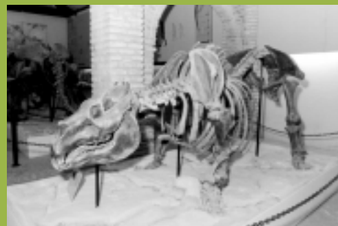
Paleontologia - Museu de História Natural