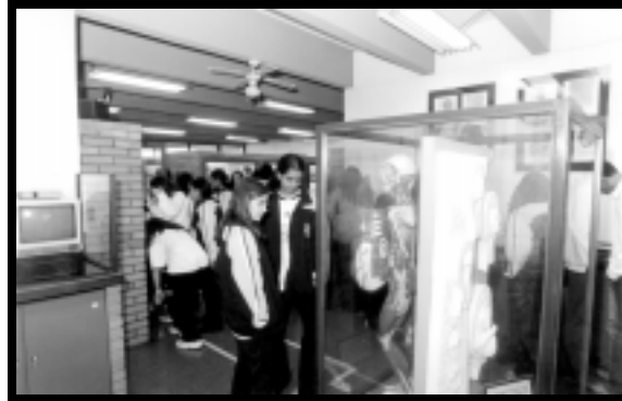
Museu de Ciências Morfológicas do ICB