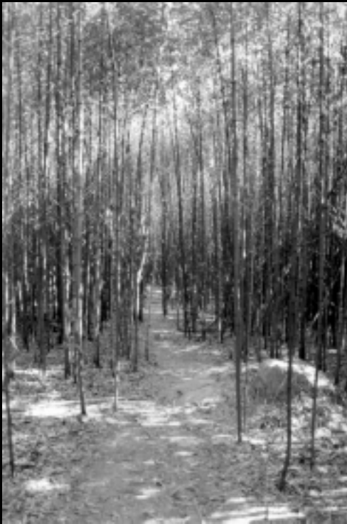
Estação Ecológica - Campus pampulha