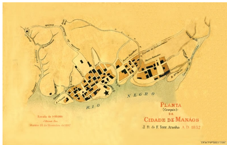
Figura 5 - Planta croqui da Cidade de Manaus de 1852, mostra os quatro tabuleiros, onde a cidade se instalou. Autor: J. B. de F. Tenreiro Aranha.

“Em cada porto, havia uma multidão de índios (...) Esta aldeia se estendia por mais de duas léguas e meia (...) No sábado, o Capitão mandou aportar em uma aldeia onde os índios se preparavam para se defender; apesar disso, os expulsamos de suas casas. Provimo-nos de comida (...). Nesse mesmo dia, prosseguimos viagem, vimos a boca de um outro grande rio que entrava pelo que navegávamos, pela margem esquerda, cuja água era negra como tinta e, por isso, o denominamos Rio Negro ; suas águas corriam tanto e com tanta ferocidade que por mais de vinte léguas faziam uma faixa na outra água, sem com ela misturar-se. Nesse mesmo dia, vimos outras aldeias” 17 .