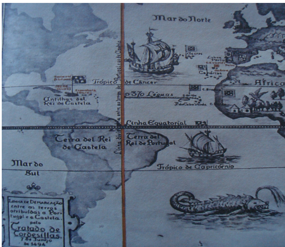
Figura 1 - Mapa mostra a linha de demarcação do Tratado de Tordesilhas (1494)