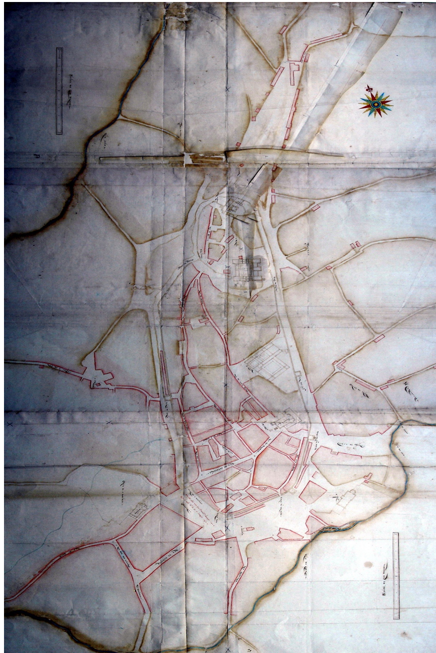
Figura 1 - “De Guimarães” [1562-70]

Com as revelações agora encontradas, novas questões se levantam, às quais apenas ulterior e apurada investigação poderá responder. De momento, releve-se a riqueza do manancial de informação contido em ambas as plantas, a sugerir outras indagações, certamente pertinentes para várias áreas do conhecimento.