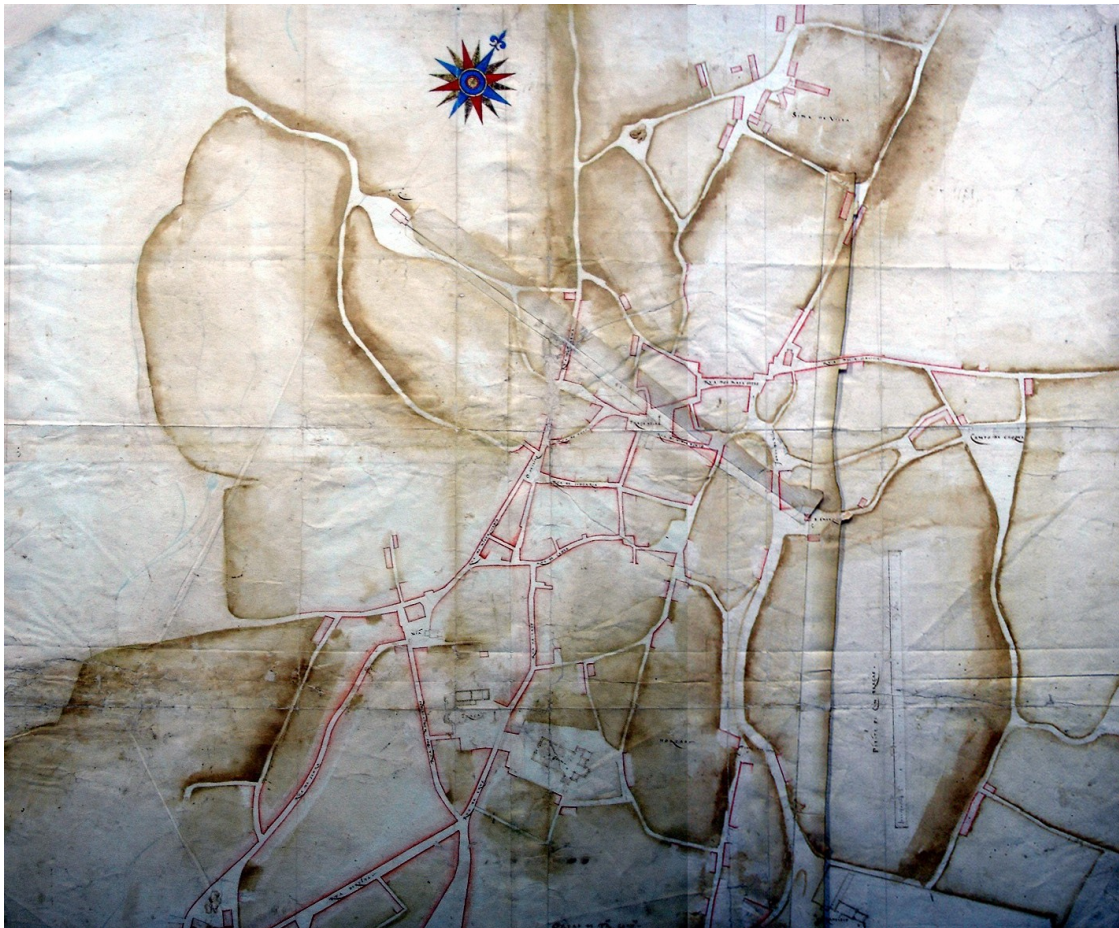
Figura 3 - "De Vila do Conde" [1568-70]