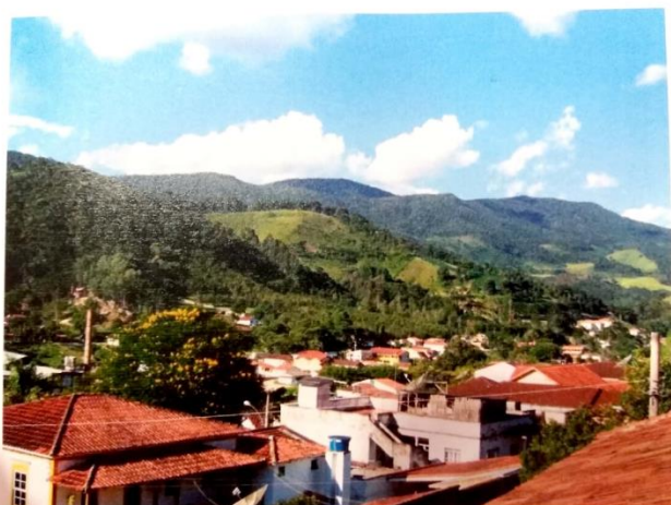
Figura 3 – Paisagem do Município de Delfim Moreira