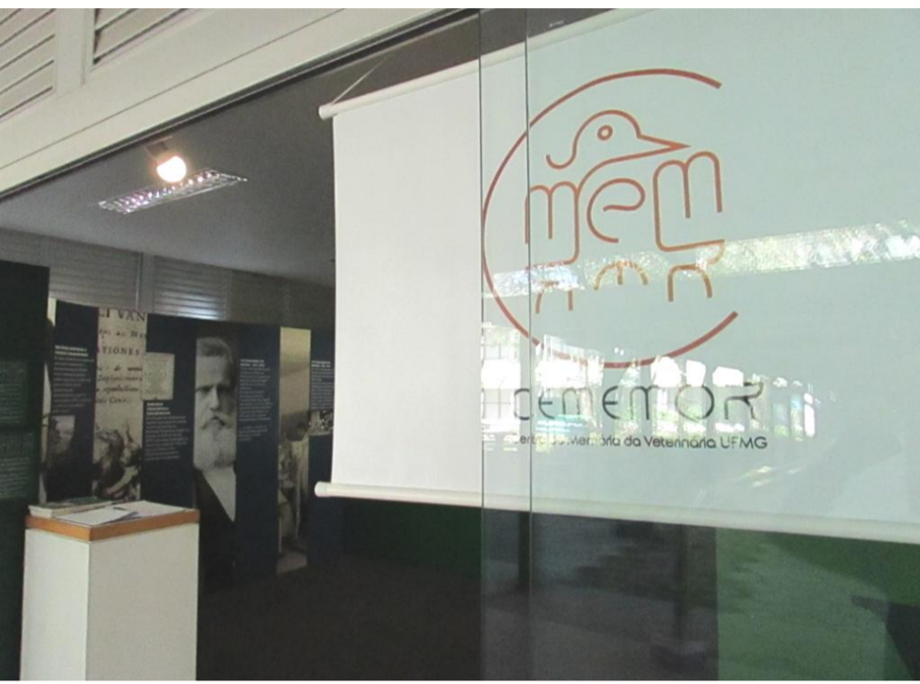
Figura 1- Sala de expografia