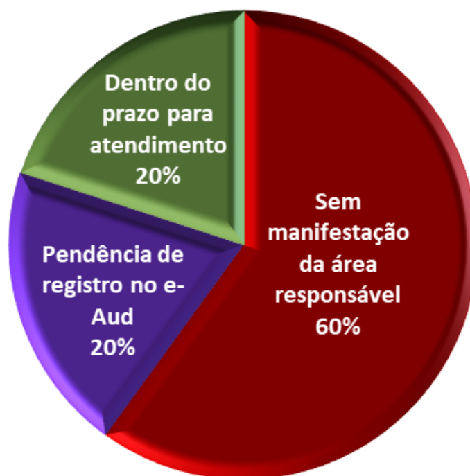
Gráfico 1 – Status das Recomendações em aberto