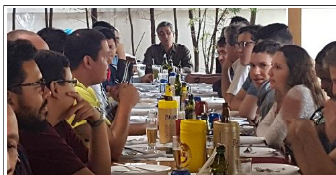
Uma das melhores fotos tiradas pela Vicentina

O SISTEMÁTICO - Publicação semanal do Centro de Computação da UFMG