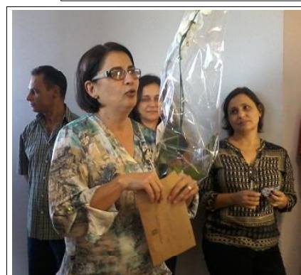
A despedida da Edir

O SISTEMÁTICO - Publicação semanal do Centro de Computação da UFMG