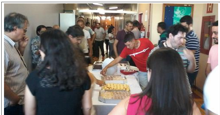
A presença dos ceconianos