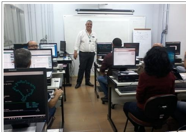
Uma visão da sala