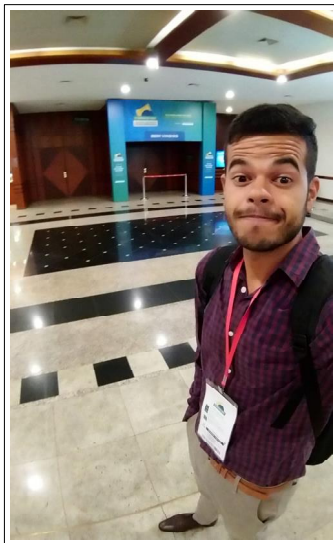
Na entrada do evento