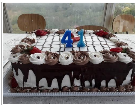
O bolo de 41 anos de O Sistemático