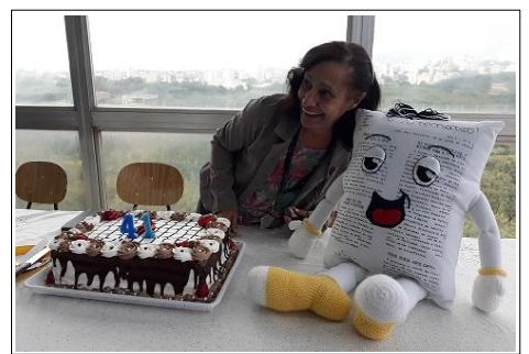
Uma pose para a posteridade