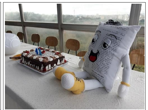
O bolo e o boneco