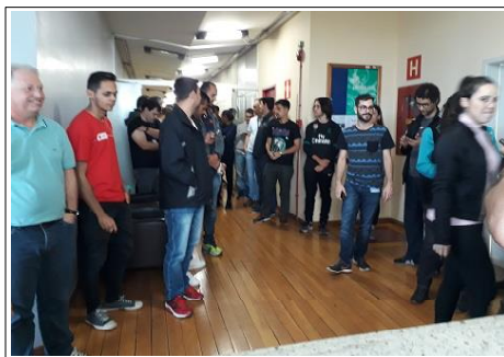
Mais convidados chegando