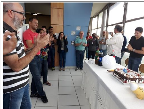
O Parabéns prá você