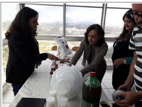
Vamos partir o bolo?