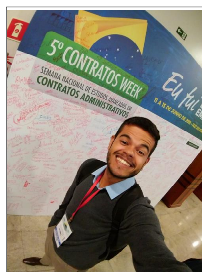
Último dia do evento