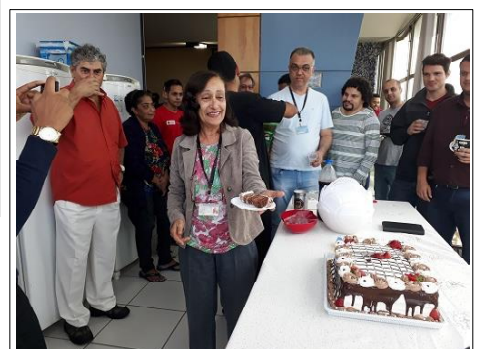
Mas o primeiro pedaço do bolo era para o aniversariante!