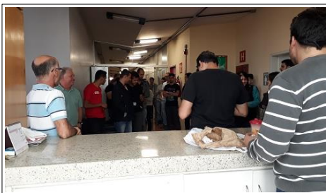
A chegada dos convidados