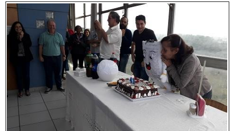
Vamos soprar a vela?