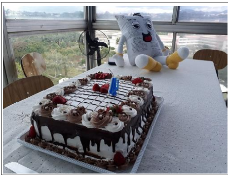
O bolo e o boneco de O Sistemático

A Redação agradece a presença e a alegria de todos em comemorar a data. E que venham muitos aniversários pela frente!