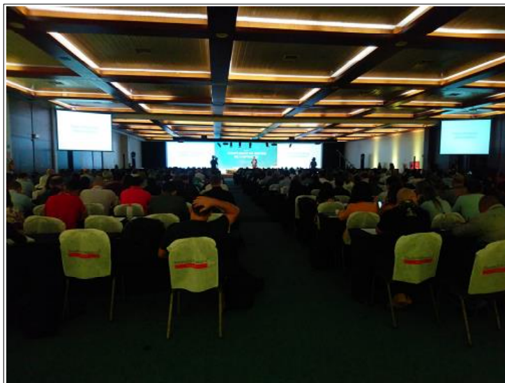
Local de realização das Oficinas