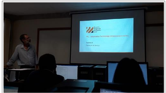
O instrutor do Mini Curso