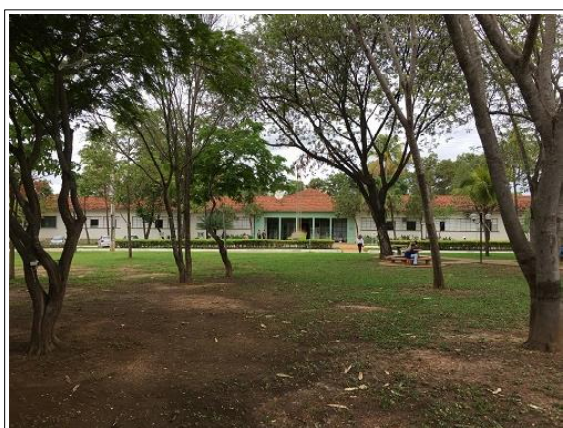
Uma visão do Bloco A