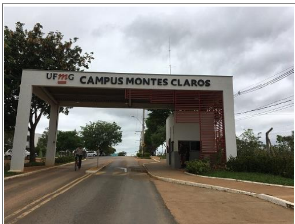
A entrada do Campus