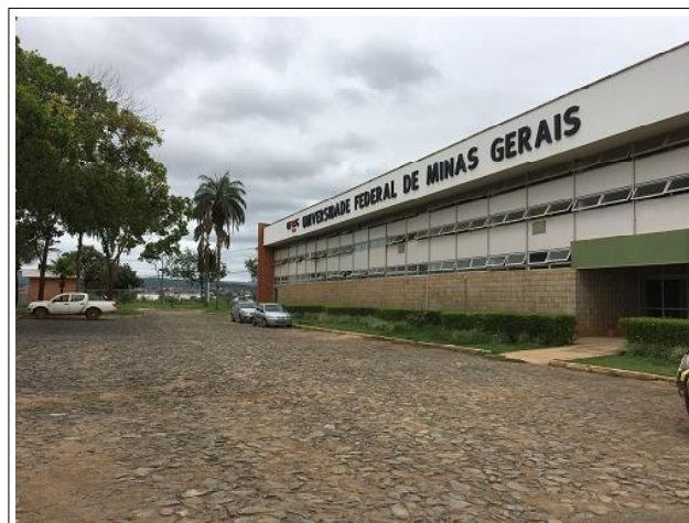
O prédio do CAAD