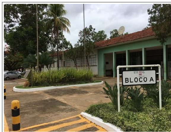
Bloco A: Administração e Laboratórios