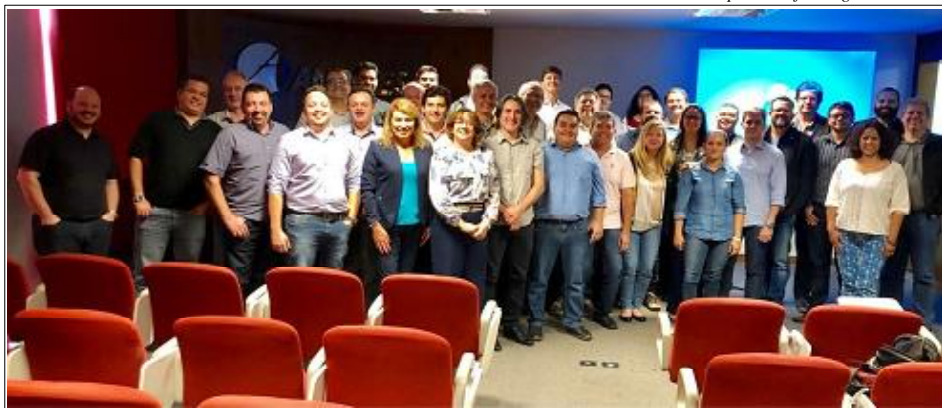
Os gestores de TI das IFES presentes à reunião do CGTIC

A reunião está sendo realizada na sede da Andifes, sendo encerrada hoje, dia 22.