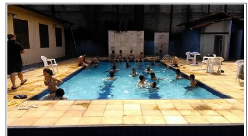
A piscina foi o local mais frequentado