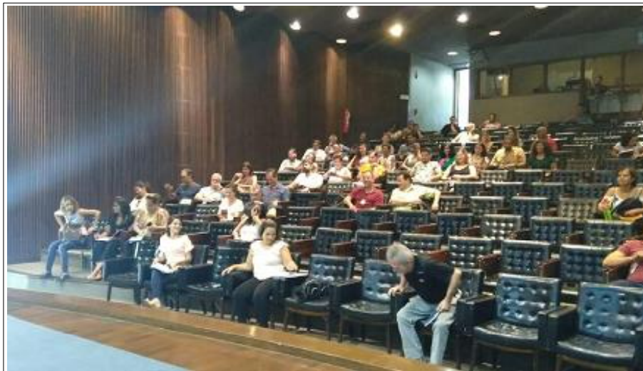
Os participantes da reunião