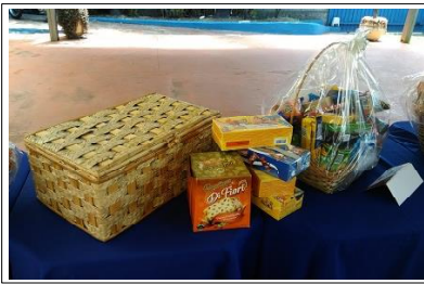
A cesta mais cobiciada: a do Bebum

Mais um lote de fotos da Festa de Natal do CECOM, realizada no dia 20 de dezembro de 2018, no Clubinho, região da Pampulha. Desta vez, as fotos são de autoria da Lelé.