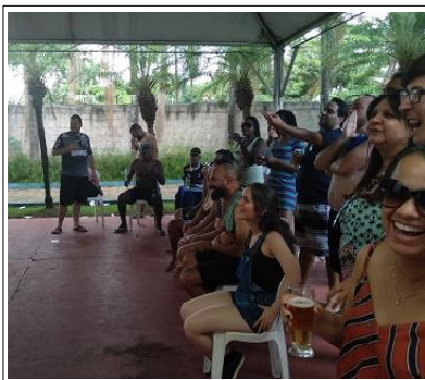
Todos queriam ganhar uma cesta