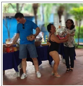
A tristeza da Takeda ao receber outra cesta