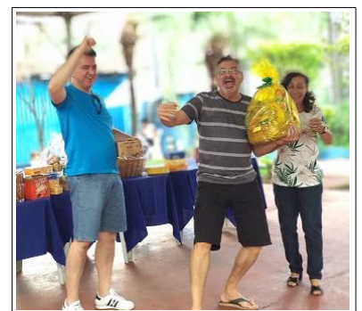
A alegria do Johnny