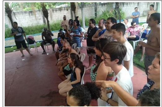
A atenção na hora do sorteio