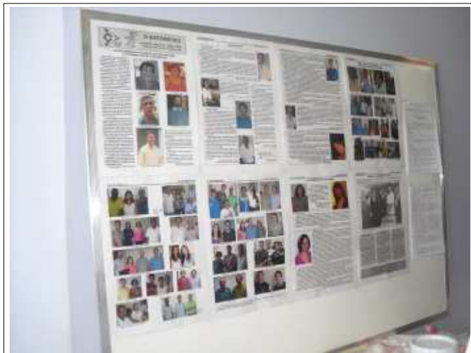
O mural com a Edição 1500 e as edições 1 e 2

O Sistemático publica fotos da comemoração dos 40 anos do CECOM e da Edição 1500 de O Sistemático, no dia 03/02/2011.