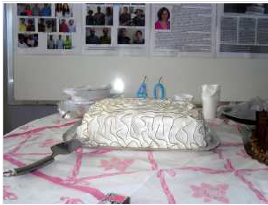
O bolo do CECOM

E, é claro, que não devemos nos esquecer de todos aqueles que passaram pelo CECOM ao longo destes 40 anos e nos deixaram aqui para continuar a jornada.