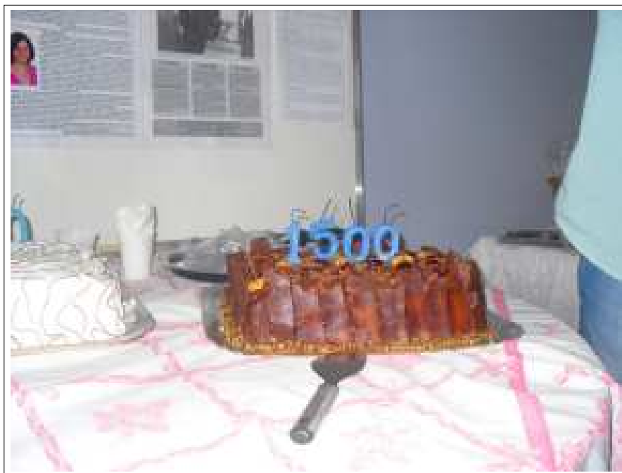
O bolo de O Sistemático