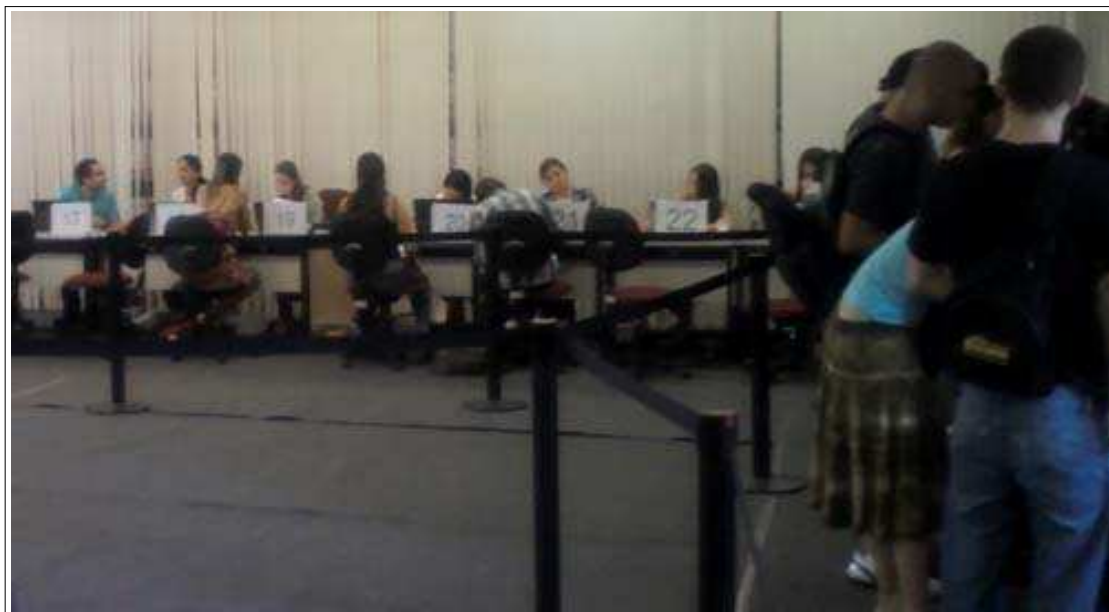
Os trabalhos do Registro Acadêmico