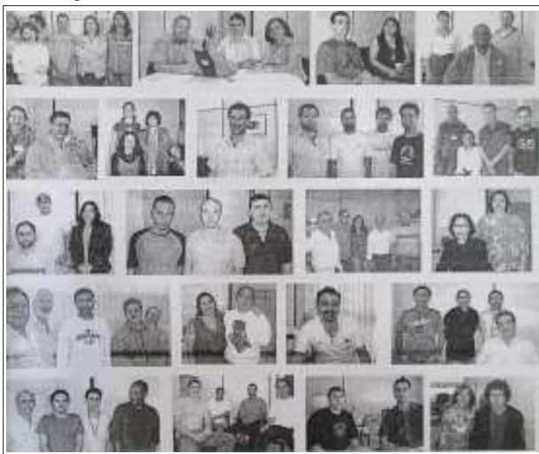
Edição 1300 - 20/07/2006