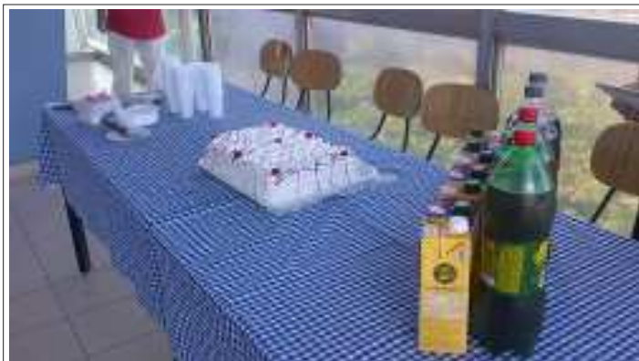
O bolo de despedida