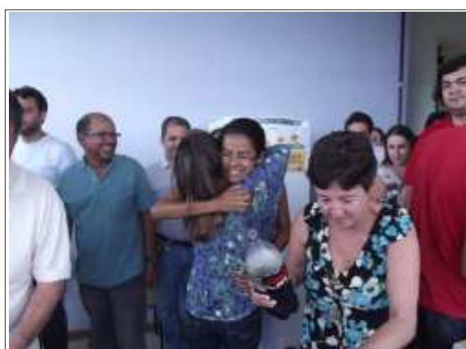
O abraço de despedida da Ruana