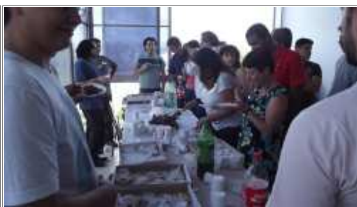
A hora de partir o bolo