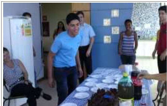
Vamos apagar a vela?