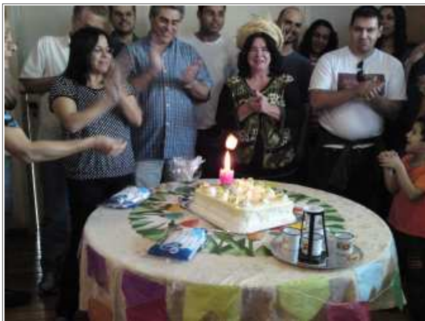
O Parabéns para você!

Mais uma foto da comemoração dos aniversários dos ceconianos dos meses de abril, maio e junho, realizada no dia 11 de julho/2012, no Espaço de Convivência do 8º andar.