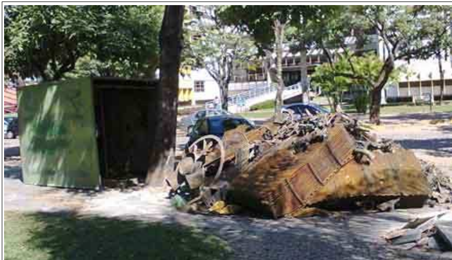
A torre de arrefecimento desmontada