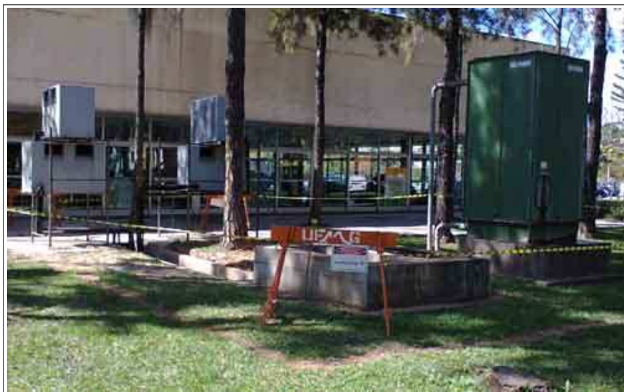
O local onde serão instalados os novos condensadores

Os canos de água e as bombas d'água da casa de máquinas, na área da DCP, já foram retirados, restando agora, o encanamento do corredor até a torre de arrefecimento, o que já está sendo feito. Esta semana, a torre de arrefecimento foi desmontada e retirada, devendo também ser recolhida para o depósito do DLO.