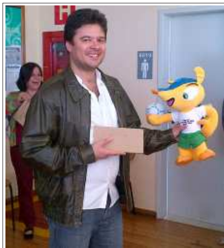
Euler também ficou em segundo lugar na primeira fase