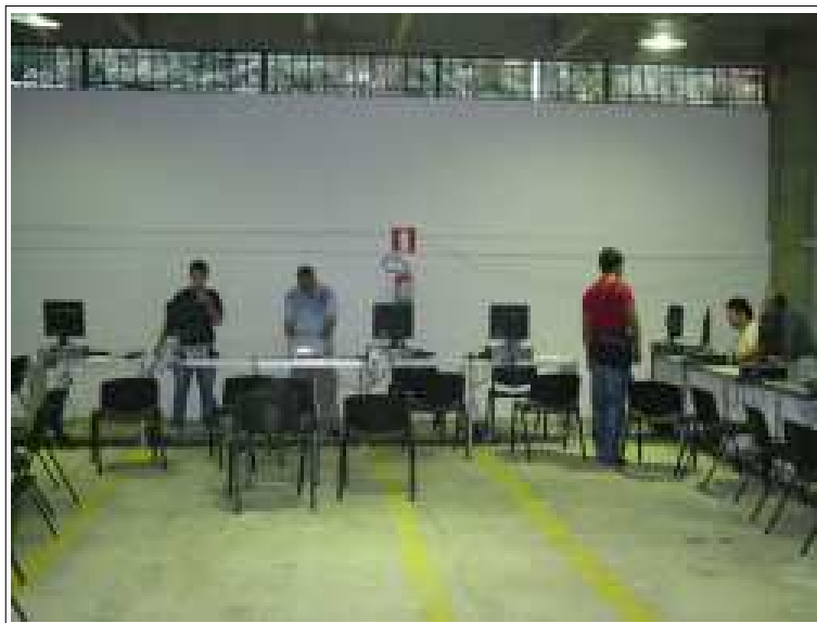
A preparação da infraestrutura do registro acadêmico com o pessoal do CECOM