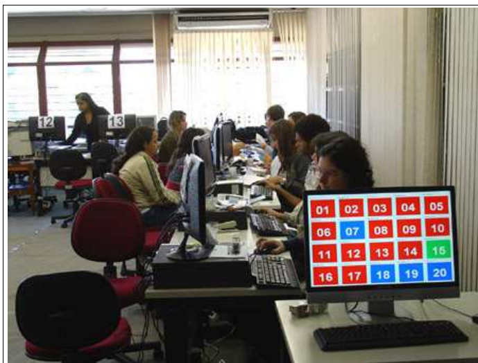
A recepção aos calouros

pela DTI. No Portal, os alunos terão à sua disposição serviços como e-mail, diário eletrônico, um espaço específico para cada uma das disciplinas em que estiver matriculado, acesso às informações do seu registro acadêmico, dentre outros.