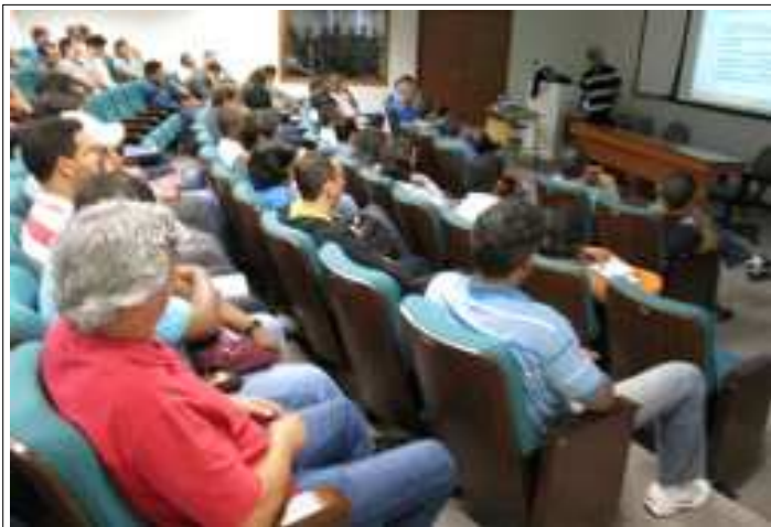
Os participantes do encontro

As fotos desta semana registram as palestras e a participação da equipe da DTI no encontro e são de autoria de Diêgo Jessé.