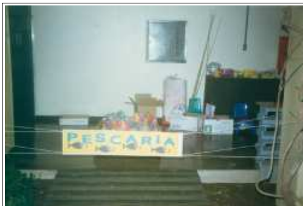
Tudo pronto para a pescaria!

O SISTEMÁTICO - Publicação semanal do Centro de Computação da UFMG