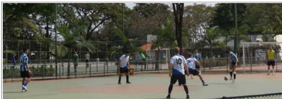
O jogo contra o Unidos do HC