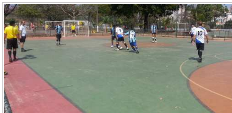
No dia 30/08, contra o HC, lá vai Horácio tentar o gol do CECOM

O SISTEMÁTICO - Publicação semanal do Centro de Computação da UFMG