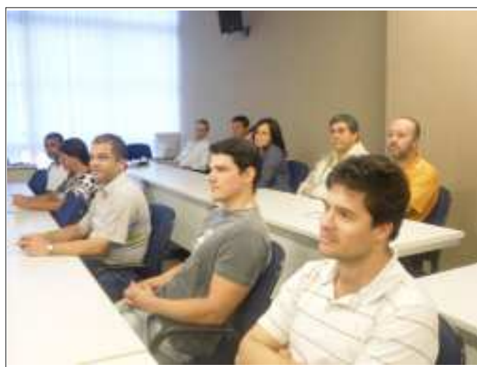
A equipe da DAS