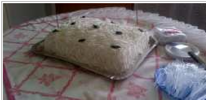
O bolo dos aniversariantes

Mais um lote de fotos da comemoração dos aniversários do terceiro trimestre, organizada pela Vicentina no dia 03/10/2013. O evento teve lugar no Espaço de Convivência do 8º andar e contou com a presença de muitos ceconianos.