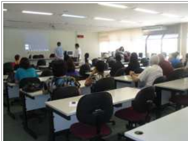
Os participantes da aula

Mais uma aula presencial do módulo de Inglês do Curso Instrumental de Línguas, organizado pelo CECOM com apoio da ProRH e professores da FALE, foi realizada no dia 31 de agosto, no Auditório da Copeve.