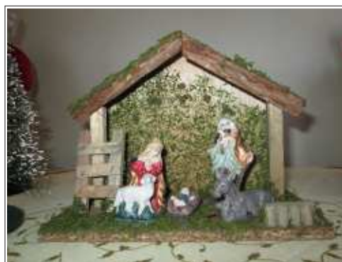
Detalhes da decoração de Natal do 8º andar.