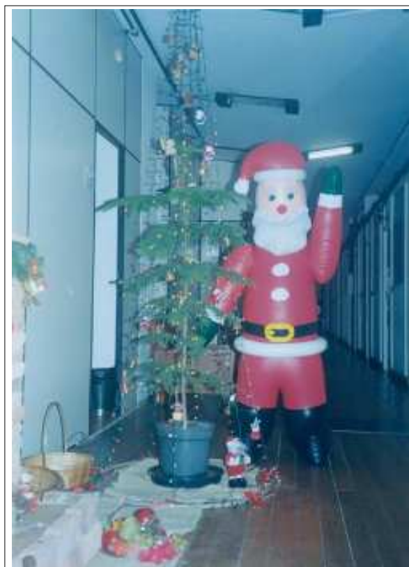
A árvore de Natal e o Papai Noel do CECOM