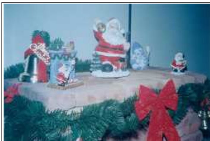
Os símbolos do Natal