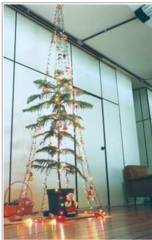
A árvore de Natal