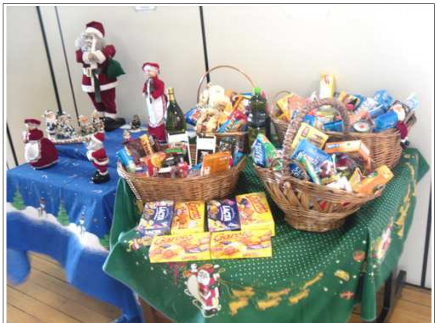
As contribuições para as cestas de guloseimas

Uma boa festa de Natal para todos do CECOM!