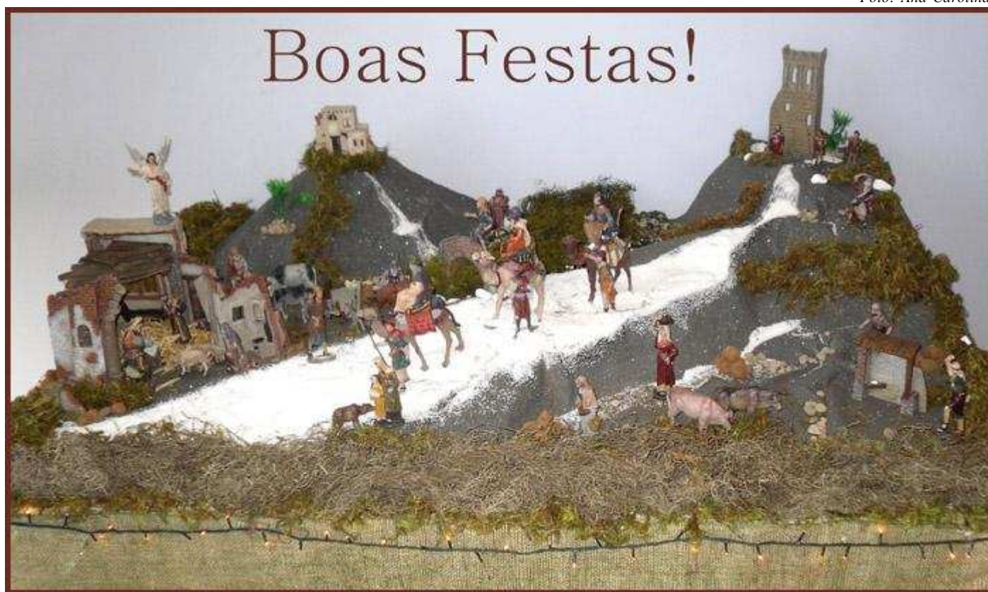
Presépio do CECOM - Criação e confecção: Lelé, Esquerria e Tatá