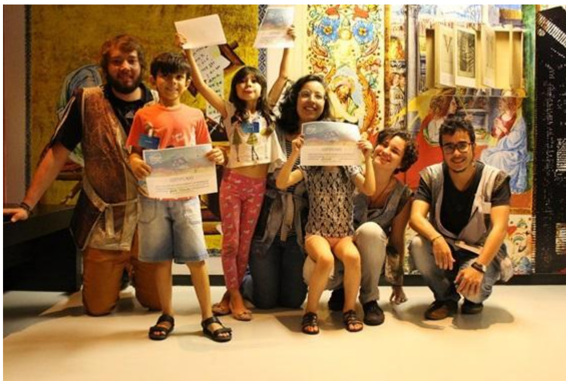
Imagem 4: Bolsistas e crianças participantes com seus certificados, em uma das oficina