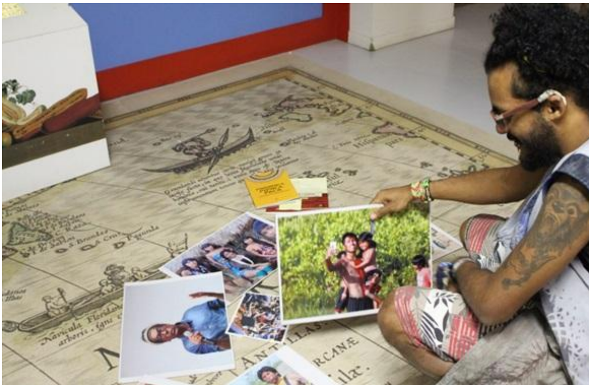
Imagem 3: Bolsista manuseando os materiais que o grupo criou para as oficinas