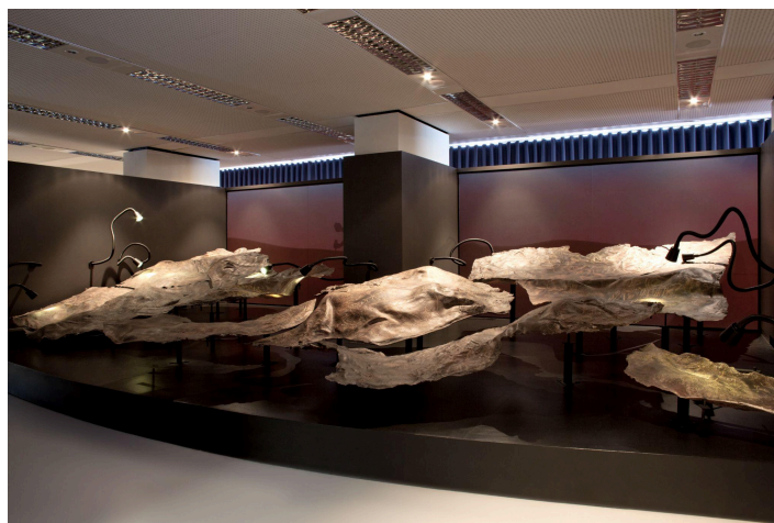
Exposição "Demasiado Humano"