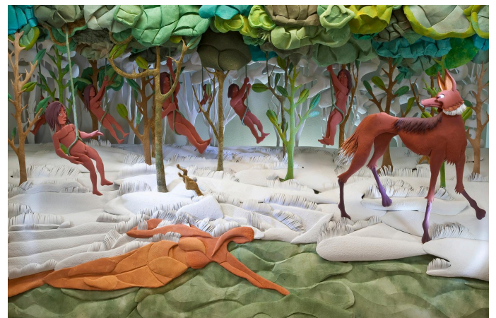
Exposição "Demasiado Humano"