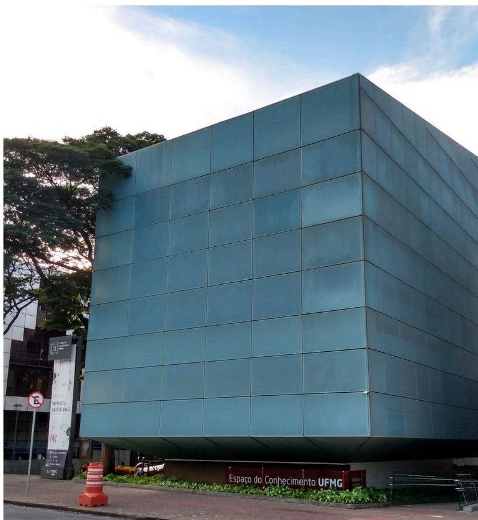
Espaço do Conhecimento UFMG

Temas ligados à cultura, artes, ciências e tecnologias são objeto de suas mostras de longa e curta duração, distribuídas nos cinco andares do edifício, que contém salas de exposição, planetário, terraço astronômico, sala de oficinas, cafeteria e escritórios de trabalho da equipe. Os espaços expositivos buscam aproximar o cidadão da ciência e da arte por meio de recursos tecnológicos e audiovisuais. A fachada digital, face externa do edifício, transforma-se em um local de projeção de conteúdo audiovisual, sendo o cinema ao ar livre da Praça da Liberdade. O funcionamento para o público espontâneo ocorre de terça a domingo, com visitas agendadas todos os dias, à exceção dos domingos.