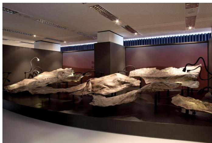
Exposição "Demasiado Humano"