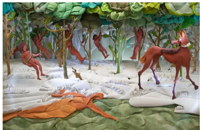
Exposição "Demasiado Humano"