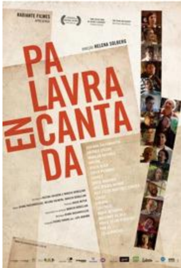
Cartaz do filme Palavra (En)cantada , 2009.

- Exibição: Palavra (En) cantada , 2009. Dir: Helena Solberg. Documentário. 1h26min, cor, HD.