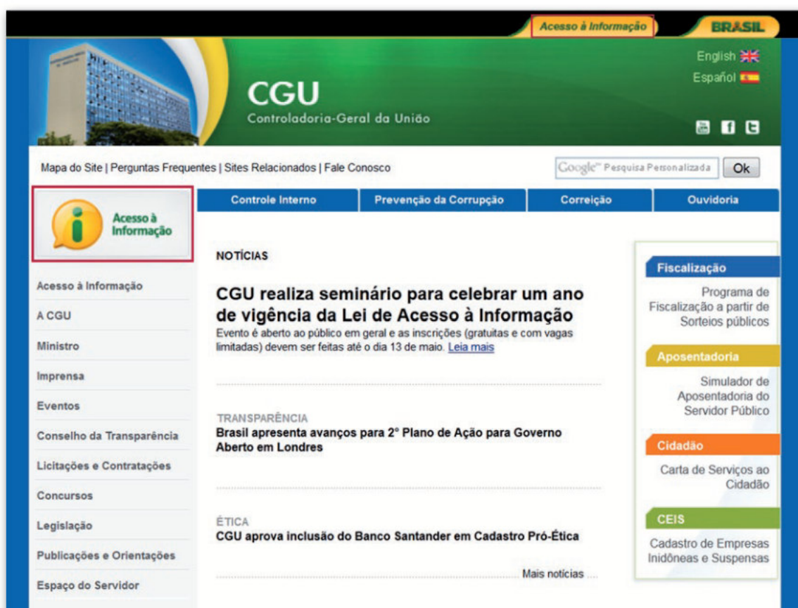
Figura 1 - Controladoria-Geral da União: http://www.acessoainformacao.rs.gov.br/

Além do acesso por meio de banner, o órgão/entidade também poderá inserir item de navegação no menu principal da página inicial de seu sítio eletrônico denominado "Acesso à Informação". A figura abaixo ilustra o padrão para a disponibilização de banner e a criação de item de menu na página inicial dos órgãos/entidades federais.