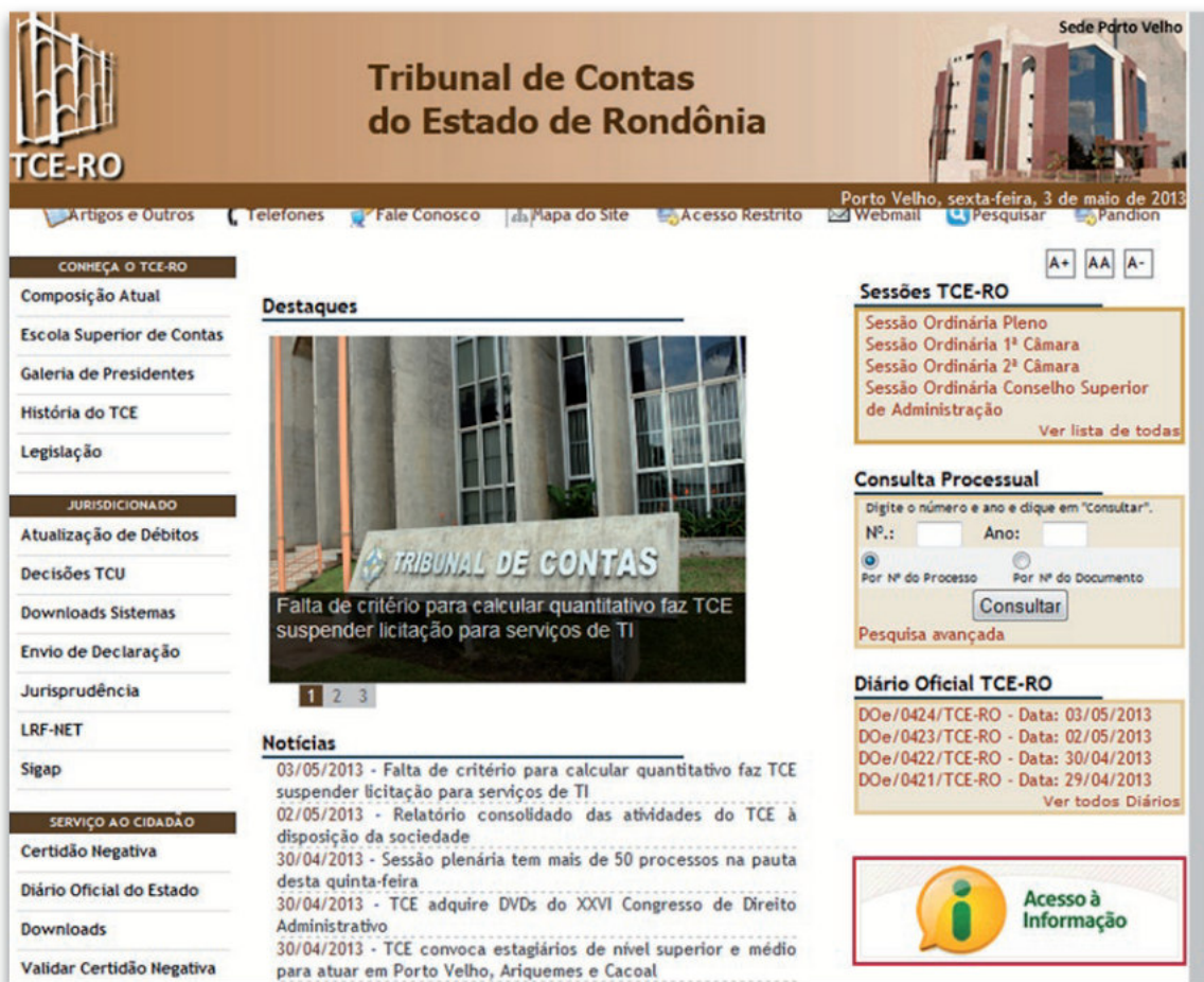
Figura 3 - Órgão do Estado de Rondônia: http://www.tce.ro.gov.br/