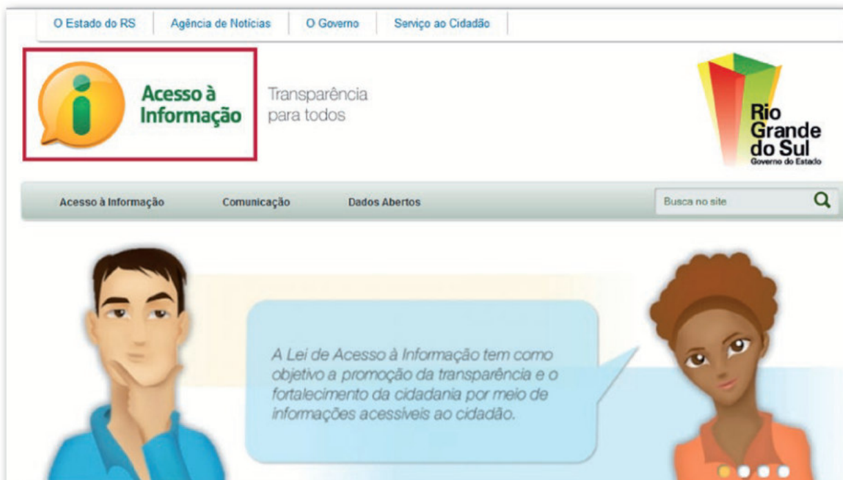
Figura 2 - Governo do Estado do Rio Grande do Sul: http://www.acessoinformacao.rs.gov.br/

A seguir, seguem exemplos de aplicação de modelos padrão para a criação de endereço eletrônico (URL) para divulgação do conteúdo sobre acesso à informação em órgãos/entidades estaduais e municipais: