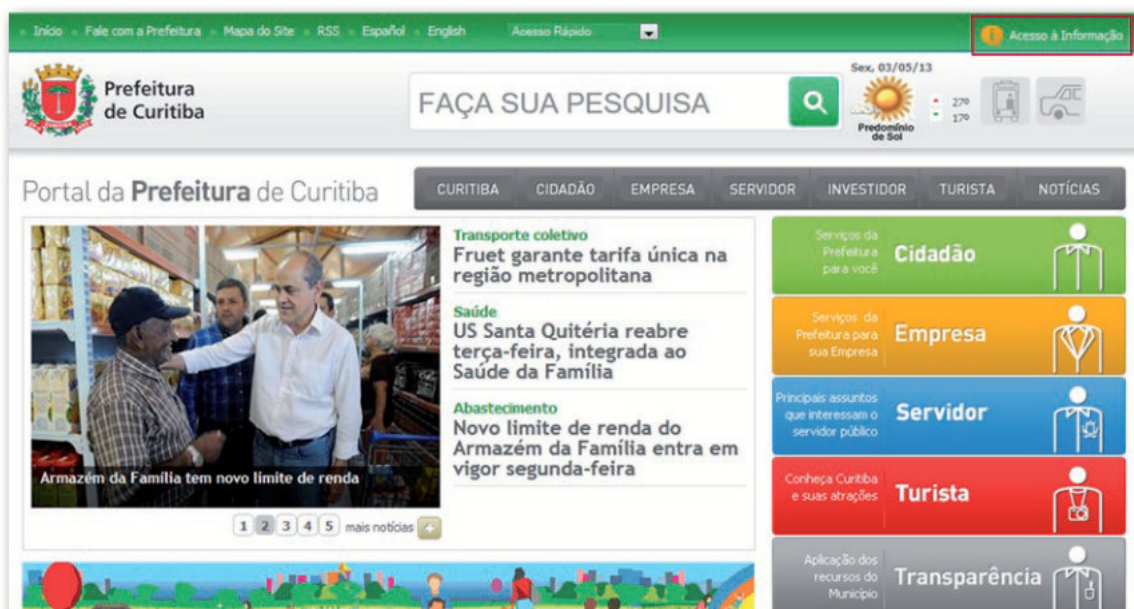
Figura 3 - Município de Curitiba: http://www.curitiba.pr.gov.br/