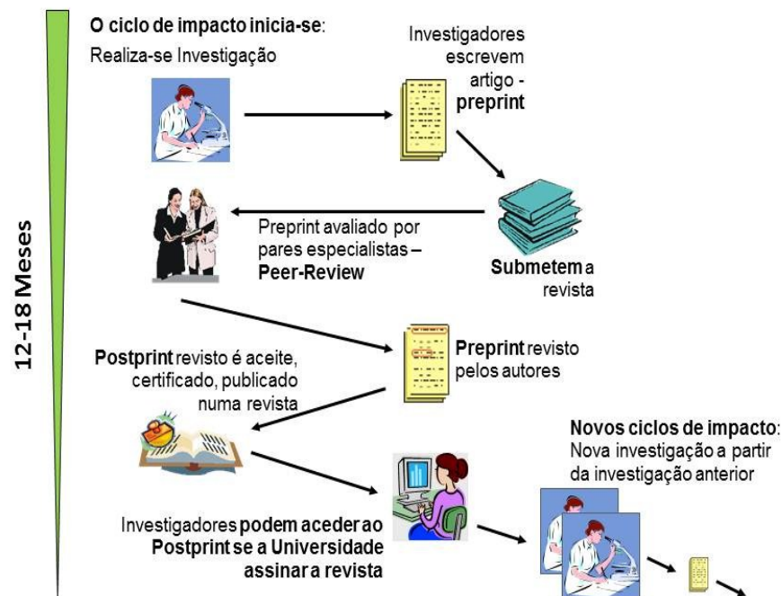
Figura1: Modelo da Comunicação Científica Tradicional (RODRIGUES, 2008)

Vickery(1999) publicou um modelo que “engloba em seus pressupostos a transferência por meio de canais eletrônicos” (BENCHIMOL, 2009, p.44), fazendo um mapeamento que incluía a transferência da informação científica em meios eletrônicos, abrangendo desde a comunicação informal ( e-mails , listas de discussão etc) até a comunicação formal (OPACS, periódicos eletrônicos etc.) (VICKERY, 1999; PINHEIRO, 2003).