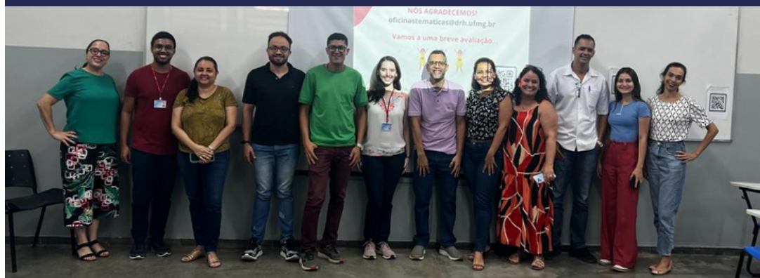
Foto dos servidores que participaram do encontro no ICA.I

Nos dias 25 e 26 de outubro de 2023, a Divisão de Acompanhamento Funcional (DAF/DRH) realizou o evento "Programa PASSO: reflexões sobre integração, avaliação e carreira dos/as servidores/as TAE" no Instituto de Ciências Agrárias (ICA/UFMG), em Montes Claros. Tal evento contou com um Encontro e duas Rodas de Conversa, que objetivaram a apresentação do Programa de Apoio ao/a Servidor/a em Socialização Organizacional (PASSO) e a divulgação de aspectos importantes sobre a gestão do conhecimento entre os/as servidores/as TAE, bem como informações sobre a carreira. Houve 32 participações nos três momentos de evento, que contou com a presença de chefias, servidores/as (novatos/as e veteranos/as), profissionais de RH e Seção de Pessoal.