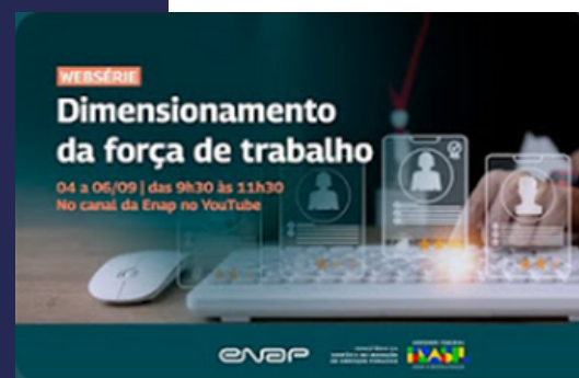
Figura com o material gráfico da Websérie Dimensionamento da Força de Trabalho. Ao fundo uma pessoa usando um notebook, o título da Websérie, datas e horários.

No Portal do Servidor também constam diversos materiais sobre a temática. Fique por dentro desse assunto tão importante para a Gestão de Pessoas!