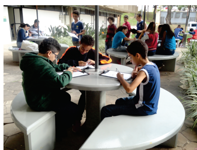
Figura 2 - a foto ilustra alunos do Ensino Fundamental preenchendo o formulário avaliativo após a visita ao acervo do Museu de Ciências Morfológicas

A pesquisa também está categorizando entre escolas pública e particular, cujos dados serão apresentados nos trabalhos futuros.