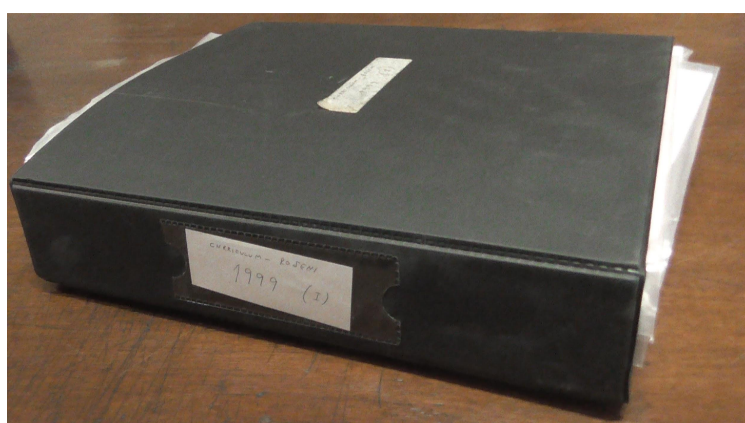
Imagem 1: acervo arquivístico antes do tratamento