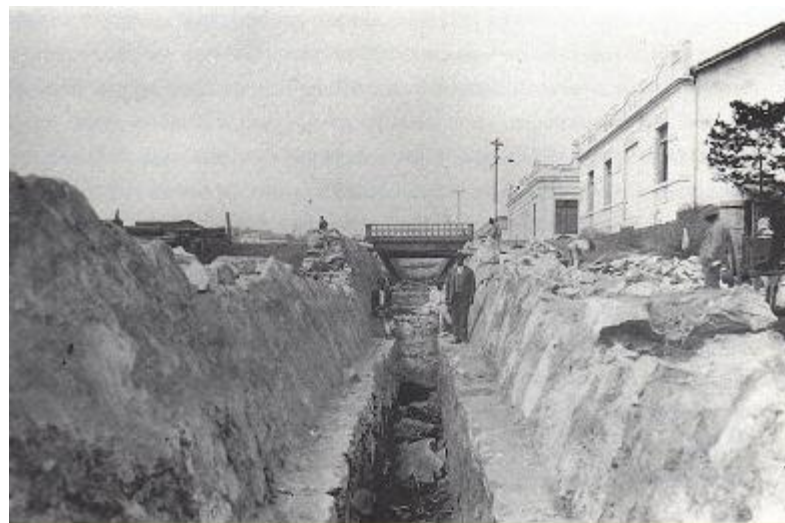
Canalização do Córrego do Leitão nas proximidades da sua foz.