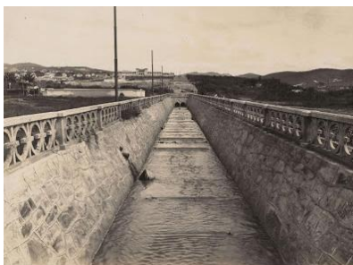
O Córrego do Leitão canalizado entre as ruas Gonçalves Dias e Alvarenga Peixoto.