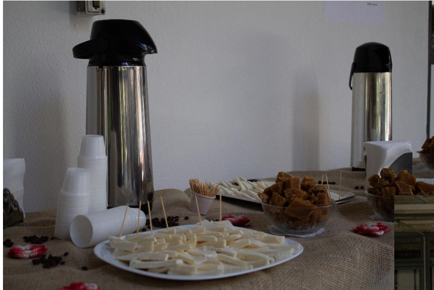
“Café com Rapadura”.

EDUCAÇÃO de qualidade para o desenvolvimento sustentável