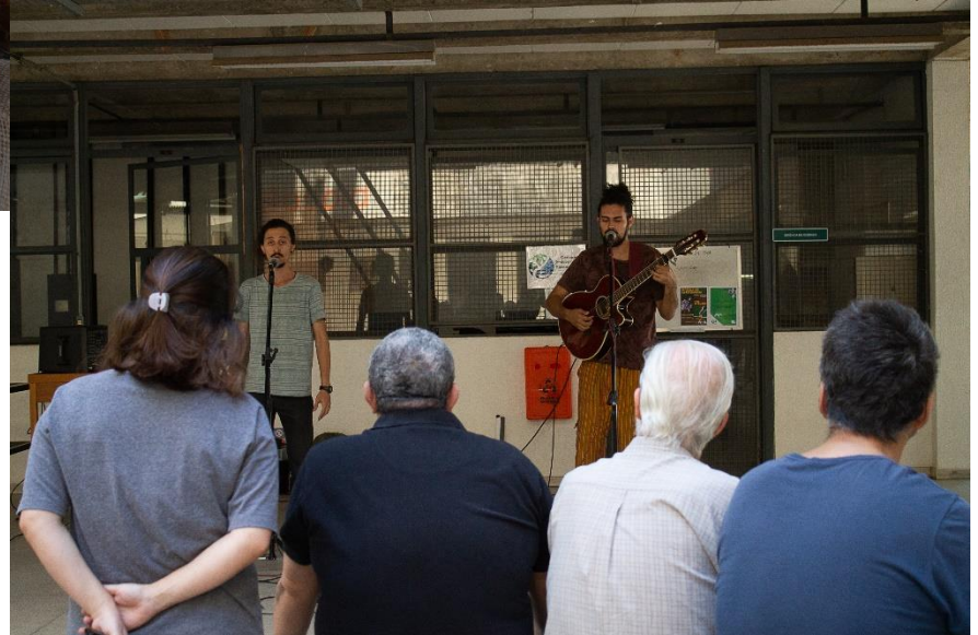
1ª Rodada Cultural do CEMEMOR-VET.