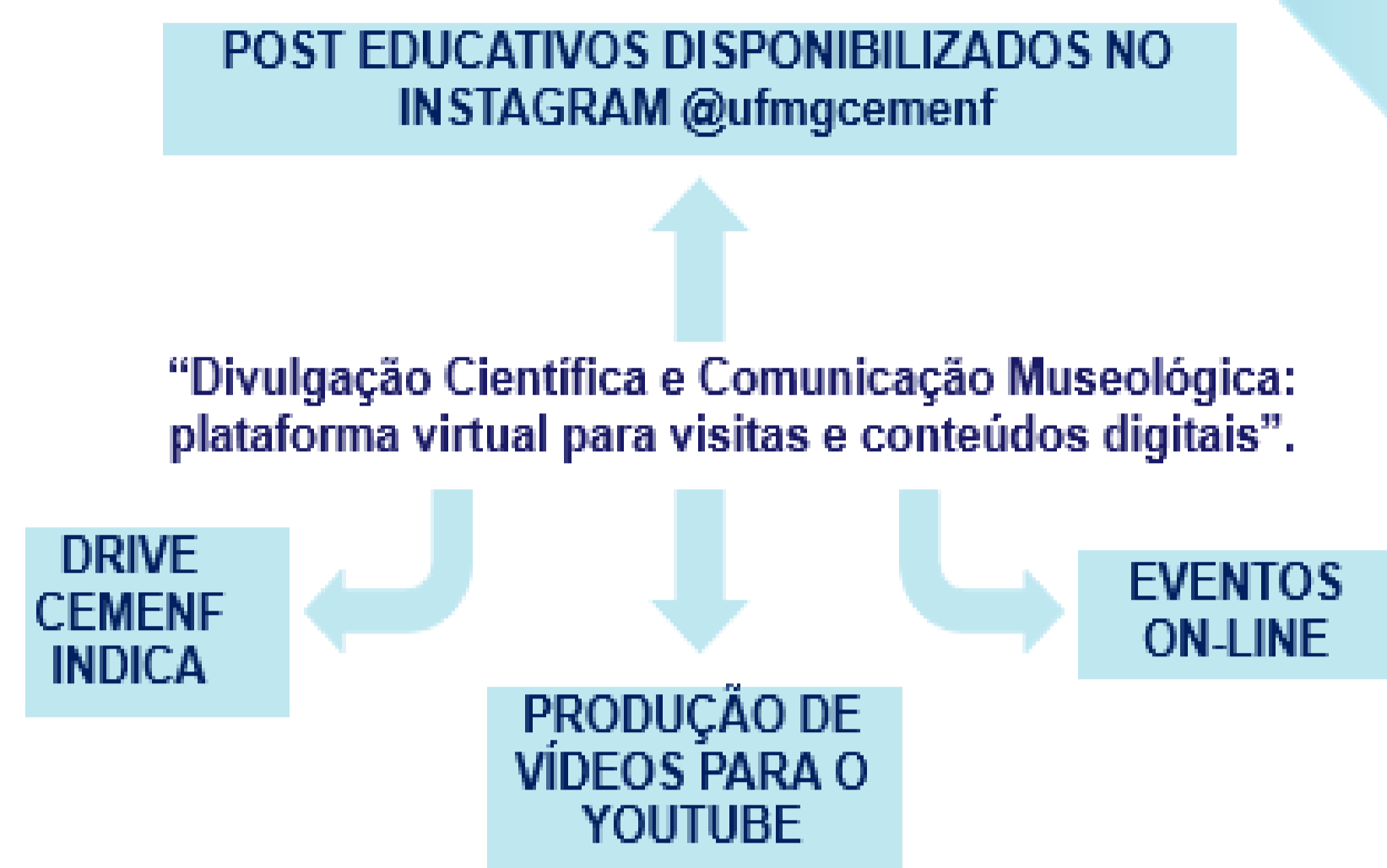
FIGURA 1: Elaboração Própria.

Suas atividades envolvem a disponibilização de artigos científicos e materiais sobre a história da enfermagem bem como divulga suas produções própria.