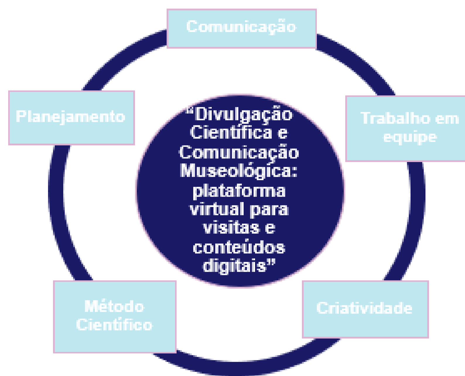
FIGURA 2: Elaboração Própria.

Com as atividades de iniciação científica, produção de conteúdo e popularização dos conhecimentos relacionados à enfermagem, os estudantes se aproximam da sociedade por meio das mídias sociais e desenvolvem habilidades a partir da interação com o público, como a comunicação, trabalho em equipe, criatividade, planejamento e método científico. Tais habilidades são estimuladas na organização e produção do conteúdo divulgado pelas discentes, por meio da divisão de tarefas em reuniões mensais, pesquisa para formulação de postagens educativas e interativas além da produção de conhecimento próprio, sob supervisão de docente da universidade.