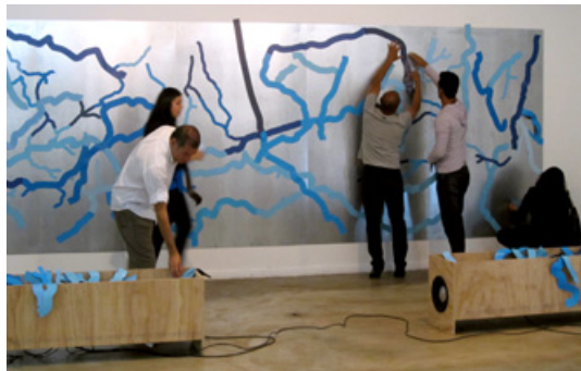
ISABELA PRADO/ FOTO: GUILHERME MACHADO Repaisagem , Instalação, 2010.

O conjunto de trabalhos que compõem o projeto Entre Rios e Ruas toma como ponto de partida a relação que Belo Horizonte estabeleceu desde sua fundação e estabelece ainda hoje com os rios e córregos presentes em seu território. Como se sabe, as especificidades das bacias hidrográficas da região não foram consideradas no planejamento da cidade, particularmente no espaço urbano circunscrito pela Avenida do Contorno, sendo